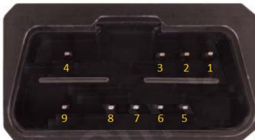
Вид разъема со стороны устройства NAVIXY A2